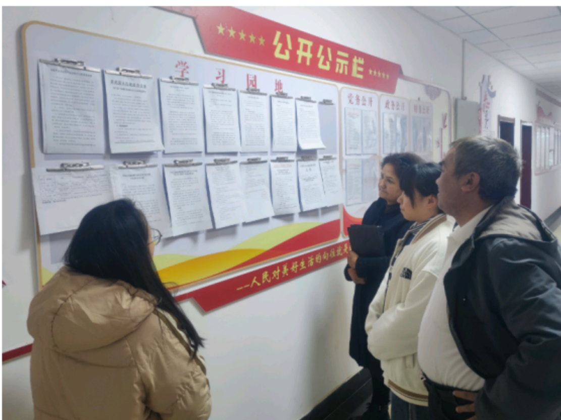
图2 公众参与第二次信息公告张贴现场照片