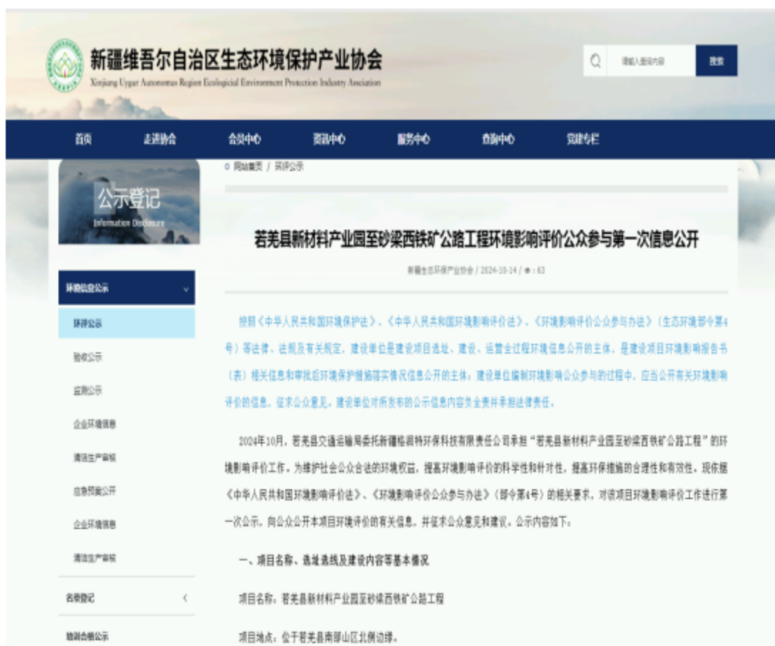
图1 公众参与第一次信息公告网络公示截图