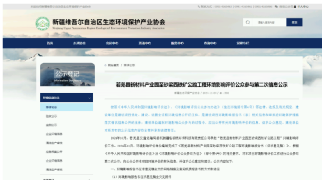
图3 公众参与第二次信息公告网络公示截图

网络公开选择的载体、公示内容、格式和公开时间均符合《环境影响评价公众参与办法》的相关要求，第二次信息公告网络公示截图见图3。